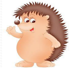
Süni 29 fő