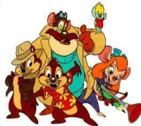
Csipet-csapat 29 fő