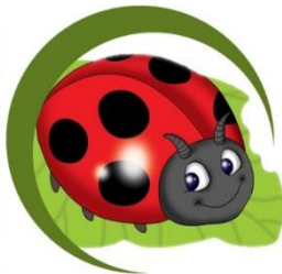
Katica 29 fő