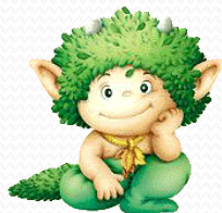
Manó 26 fő