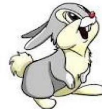
Nyuszi 29 fő