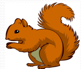
Mókus 29 fő