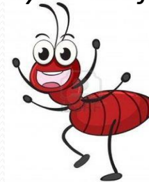
Hangya 29 fő