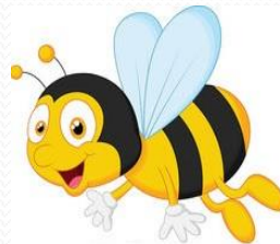
Méhecske 29 fő