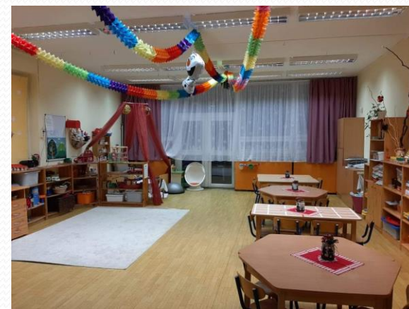
Hangya vegyes csoport