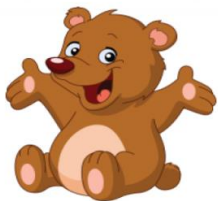
Maci 29 fő